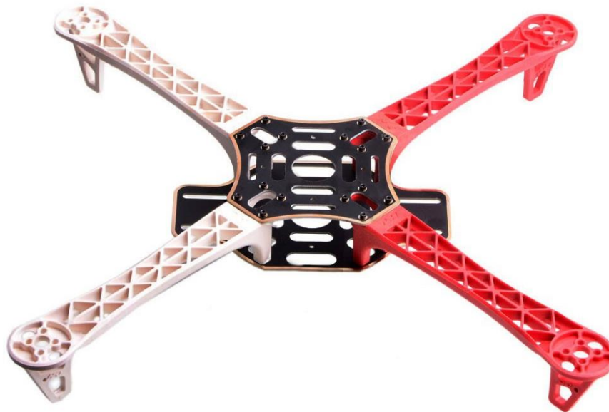
Figura 1 - Drone modelo 450

A aeronave deverá ser de asa rotativa, com motores obrigatoriamente elétricos, na configuração quadrotor , classe 450, conforme modelo apresentado abaixo: