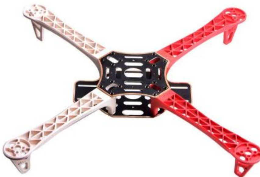
Figura 1 - Drone modelo 450

A aeronave deverá ser de asa rotativa, com motores obrigatoriamente elétricos, na configuração quadrotor , classe 450, conforme modelo apresentado abaixo: