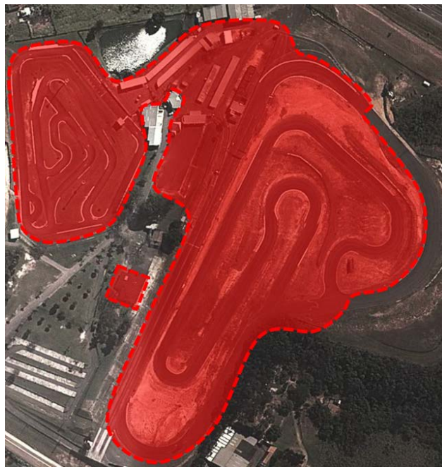
Área permitida somente a inscritos na competição

Somente terão acessos aos boxes e algumas áreas da competição os integrantes das equipes anteriormente cadastrados na secretaria da SAE BRASIL.