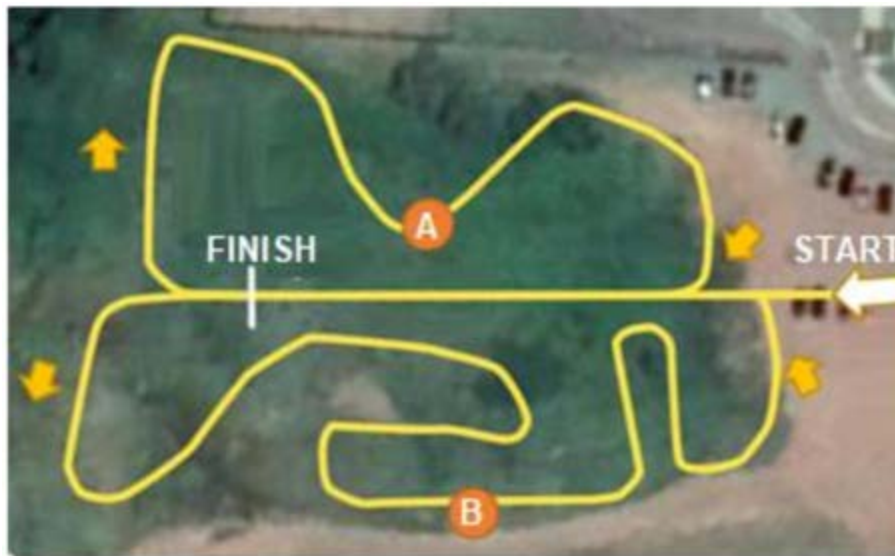
* Imagem apenas ilustrativa

Cada disputa consiste em uma corrida entre dois veículos percorrendo um mesmo traçado, porém iniciando em pontos diferentes da pista. A pista terá dois traçados (A e B), sendo que uma das equipes percorrerá primeiro o A e depois o B, enquanto a outra equipe percorre primeiro o B e depois o A. O vencedor de cada disputa será aquele que percorrer os dois traçados no menor tempo.