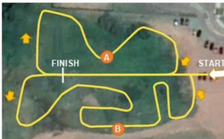
* Imagem apenas ilustrativa

Cada disputa consiste em uma corrida entre dois veículos percorrendo um mesmo traçado, porém, iniciando em pontos diferentes da pista. A pista terá dois traçados (A e B), sendo que uma das equipes percorrerá primeiro o A e depois o B, enquanto a outra equipe percorre primeiro o B e depois o A. O vencedor de cada disputa será aquele que percorrer os dois traçados no menor tempo.