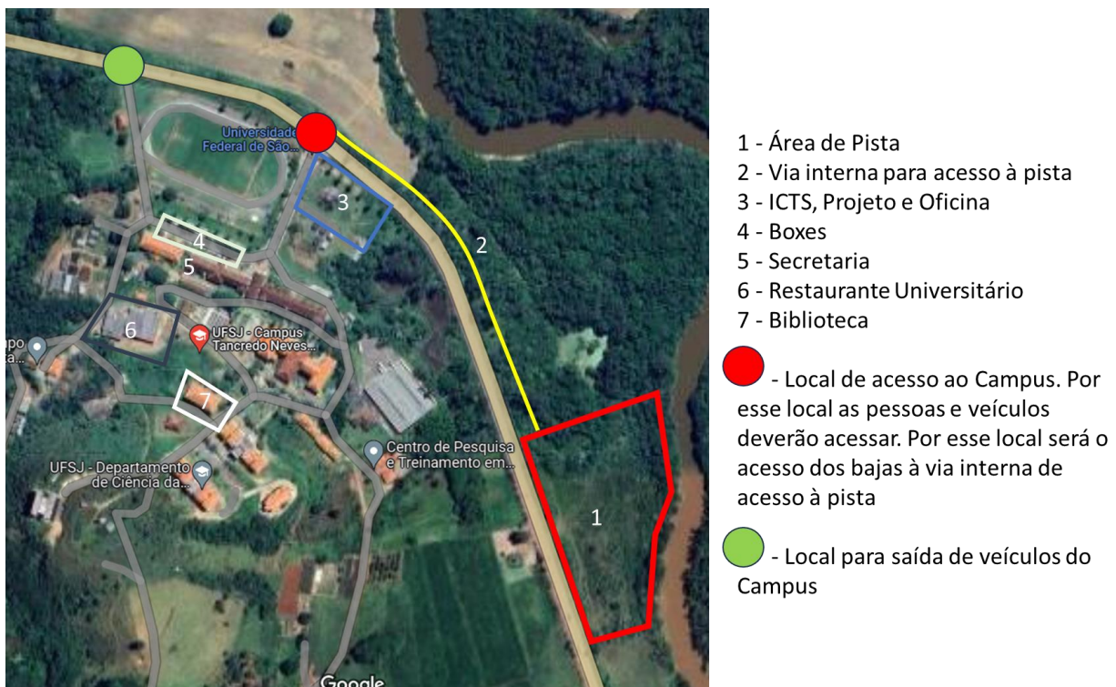
Figura 1 - Locais importantes

A Figura 1, a seguir mostra os principais locais, podendo ser modificados devido à disponibilidade do local.